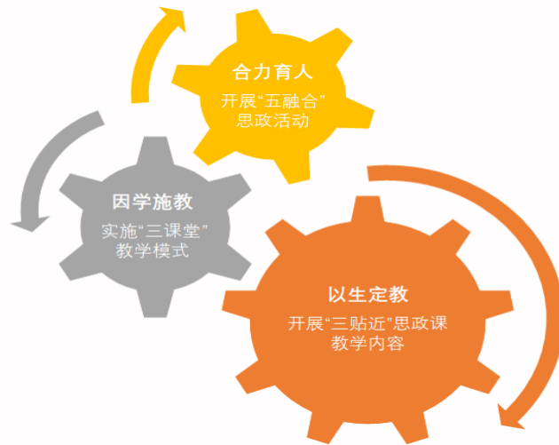
图 3 “引导-活动”教学改革思路

成果组提出解决方案：以生定教，开发“三贴近”思政课教学内容；因学施教，实施“三课堂”教学模式；合力育人，开展“五融合”思政活动。