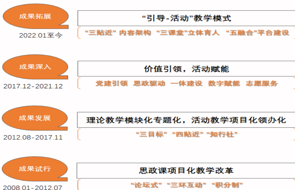
图1 “引导-活动”教学模式发展脉络