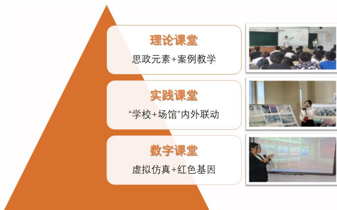
图5 “三课堂”教学模式

使命”青马主题沙龙活动，与博物馆联合开展现场教学、与牡丹江市档案馆（市委史志研究室）、四川省宜宾市赵一曼纪念馆主办烈士事迹巡展活动，开展《追寻红色印记，奋进青春力量》思政课实践研学活动，开展“让爱回家”公益志愿服务活动，每学年假期开展覆盖全校大学生“返家乡”社会实践活动；数字课堂通过与动画学院“结伴”打造“八女英魂”“青春之骏”等VR红色历史漫游作品，以“身临其境”推进“虚拟仿真+红色基因”体验教育。