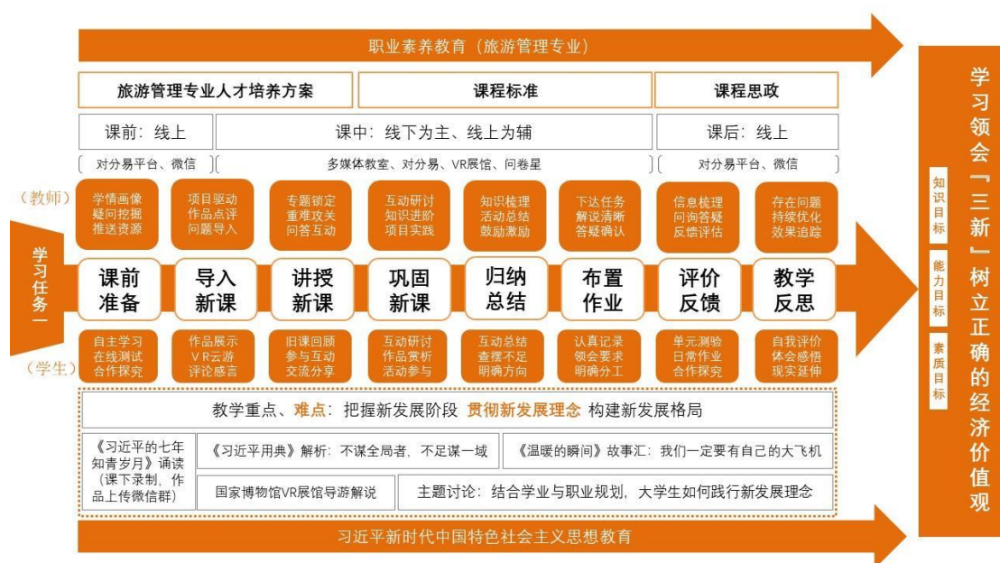
图7 “引导-活动” 教学模式设计案例

动党政齐抓共管育人工作，打造出显性、生动、多样的平台载体，深度挖掘思政课教学与党建、专业课、大中小学思政课、信息技术、志愿服务实践的融合点，推动了思政课目标、内容、载体、师资等融合元素的同建促建。以“思政+”内容逻辑体系、立体化职业素养培育体系、双线任务驱动打造的作品获得 2021 年黑龙江省职业院校技能大赛教学能力比赛暨国赛二等奖。