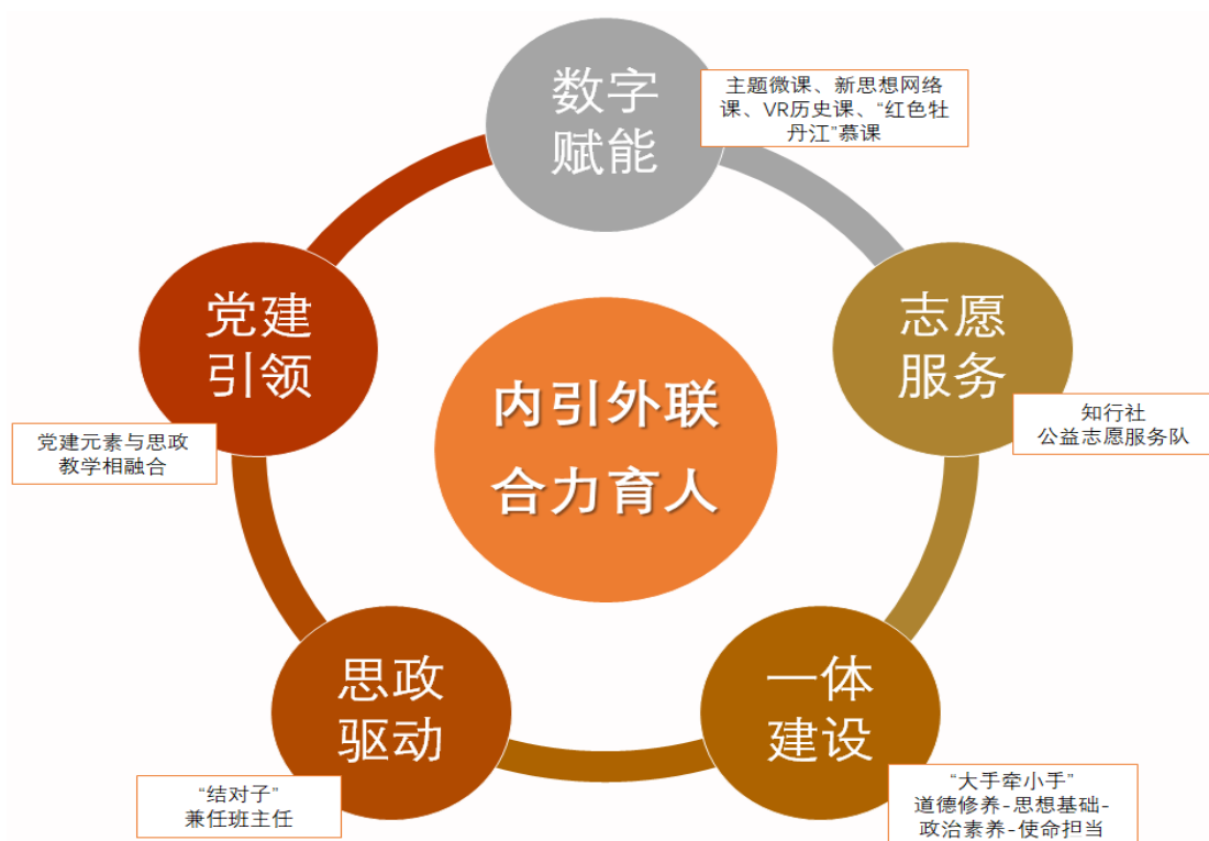
图6 “五融合”思政活动

当”思政课一体化共建共享活动，推动思政课与专业课、大中小学思政课相融合、信息技术与思政课相融合、思政课与志愿服务实践相融合。邀请多方主体众筹丰富主题微课、新思想网络课、VR历史课、“红色牡丹江”慕课等数字载体，推动信息技术与思政课相融合。依托“公益志愿服务队”与“知行社”，深入部队、企业、社区、乡村开展职业体验志愿服务活动，推动思政课与志愿服务实践相融合。